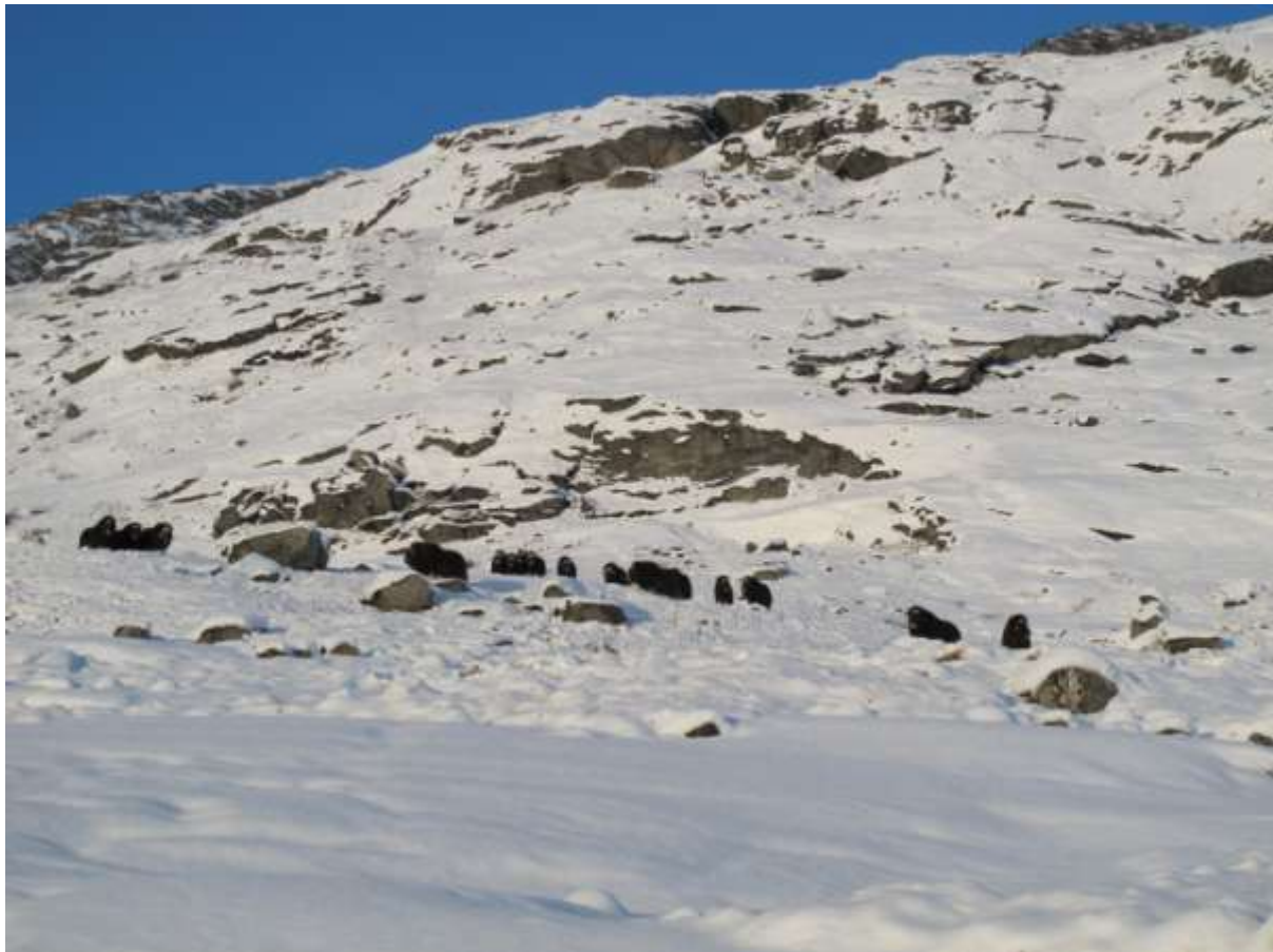
Figur 3. Umimmaat Saqqarsuup Qooruata Kangersornigullu avanaa'tungaaniittut. Assiliisoq: Ivali Lennert.

Nuup eqqaani 2012-imi marsimi Pinngortitaleriffimmiut tutunuk kisitsinerminni umimmannik takusaqarsimangillat. Akerlianik Silap Pissusianik Ilisimatusarfimmiut umimmaat ataatsimoortut 18-t avannarpasissutsimi 64^{\circ} 25.830' -imi kippasissutsimilu 49^{\circ} 51.529' -imi naammattoorsimavaat. Umimmaat Saqqarsuup Qooruata anigguata eqqaani kangerluup paavata eqqaaniipput (Fig. 3). Umimmaat piffissami februaarip uluisa arfernaniit qulingata tungaanut aamma februaarip ulluisa 18-ani 19-anilu arlaleriarlugit naammattoorneqartarput.