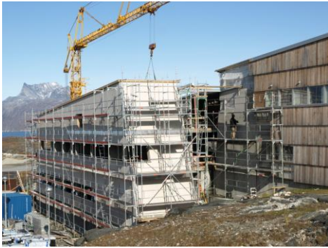
Udvidelsen af instituttet forventes færdigt sommeren 2010.

Naturinstituttet vil gennem perioden øge sine kontor- og laboratoriefaciliteter fra ca. 2.000 til 2.800 m 2 og derved skabe rammer for op til 70 medarbejdere.