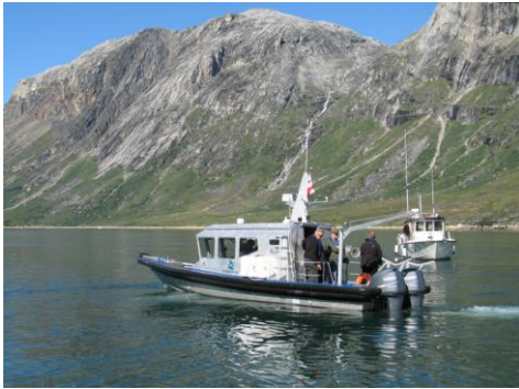
Aage V. Jensen II.

Såfremt planen gennemføres, vil Grønland i 2012 være stærkere rustet med viden og kompetence vedrørende såvel levende ressourcer, klimaændringer og miljøspørgsmål, og samtidig være i besiddelse af betydelige og moderne faciliteter, som vil udgøre et attraktivt aktiv for tiltrækning af international forskning og kapital til gavn for videnopbygning og arbejdspladser i Grønland.