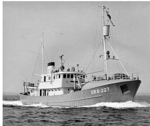
Det 42 år gamle (pr. 2009) undersøgelsesskib Adolf Jensen.