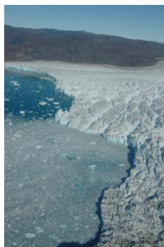
Foden af en gletcher.

Effekter af klimaforandringer i Grønland har betydning både lokalt og globalt, og der er herfor meget stor national og international interesse for forskning i disse. Der ligger et stort potentiale for international finansiering af forskning, som kan komme det grønlandske samfund til gode, og som allerede har resulteret i oprettelsen af eksternt finansieret forskning og overvågning i relation til Naturinstituttet. Instituttet ønsker at videreudvikle disse muligheder, bl.a. gennem etablering af et større center for klimaforskning.